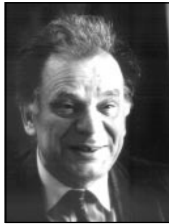
Лауреат Демидовской премии ЖОРЕС ИВАНОВИЧ АЛФЕРОВ

Первые пять школ прошли на турбазе «Коуровка». Слава о первой шко-