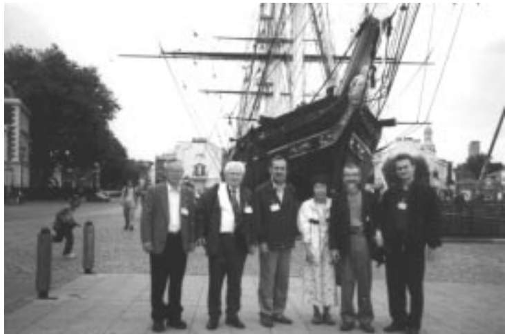
В августе в г. Гилфорде (Великобритания) проходила X Международная конференция «Физика полупроводников при высоких давлениях», на которой побывал наш постоянный автор. Предлагаем вашему вниманию его заметки о поездке.

Одними из наиболее перспективных полупроводниковых материалов, которым было посвящено наибольшее количество докладов, в настоящее время являются нитриды третьей группы и гетероструктуры на их основе (InGaN/GaN и т.д.), давшие новое семейство полупроводниковых лазеров от инфракрасного до ультрафиолетового диапазона. Изменение ширины запрещенной зоны и длины волны излучения с давлением оказалось способно пролить свет на поведение дефектных и примесных состояний, существенно влияющих на оптические характеристики лазеров.