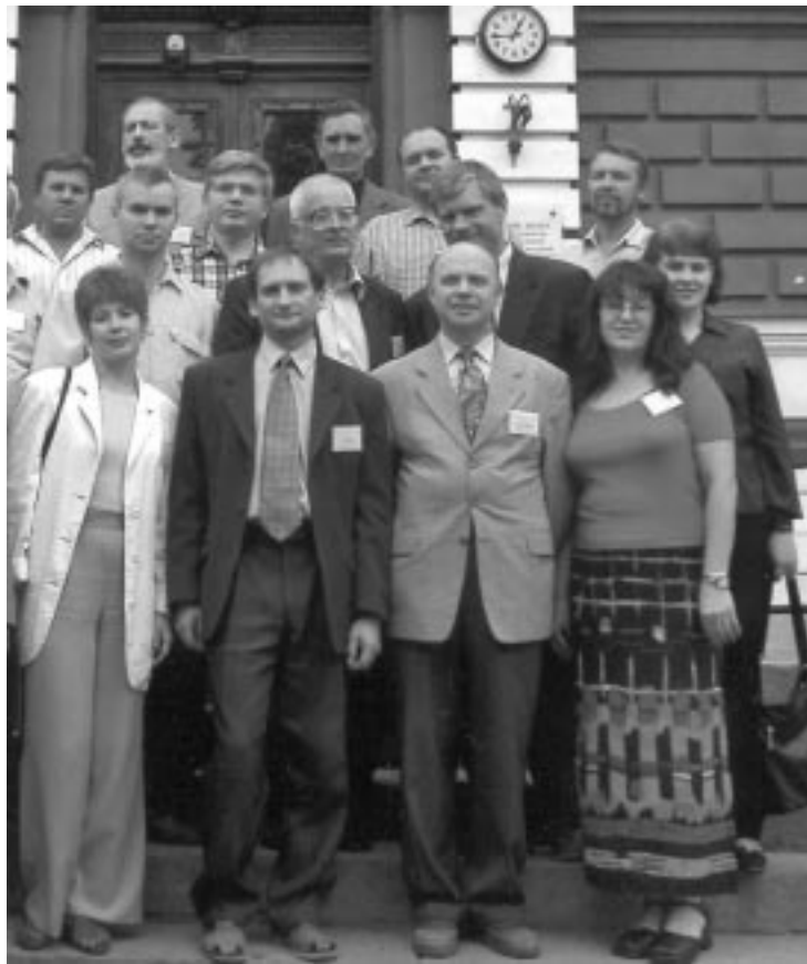
Окончание. Начало на стр. 7.

Центром таких работ было предприятие «Красная звезда». Еще в сороковые годы удалось получить наноразмерные частицы оксалатов некоторых металлов. Положительной стороной закрытости было то, что режим секретности и нераспространения сведений на 20-25 лет обеспечил отечественное лидерство. Отрицательная сторона секретности сказалась позже — отсутствие научной конкуренции и свежих научных идей привели к определенному застою в этой области науки.