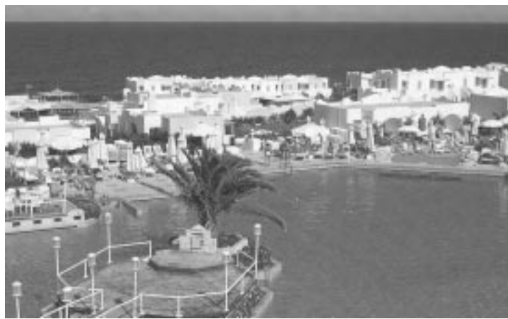
Здесь проходила конференция NATO-ASI по наноструктурам.

В июле-августе нынешнего года в течение 15 дней на острове Крит (Греция) проходила конференция NATO-ASI “Синтез, функциональные свойства и применение наноструктур”. Конференции NATO-ASI несколько отличаются от обычных международных научных симпозиумов и конференций и проводятся только по передовым научным направлениям. Буквальный перевод на русский язык аббревиатуры ASI (Advanced Study Institute) означает “институт передового обучения”. Что касается NATO, то эта всем из-