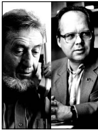
Владимир ИПАТЬЕВ, академик и генерал