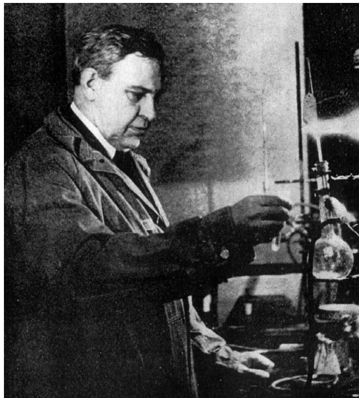
В.Н. Ипатьев в лаборатории в Riverside Oil Products Co. (1933 г.)

За 22 года работы в США В.Н. Ипатьевым с соавторами опубликовано 190 статей в американских журналах и получено