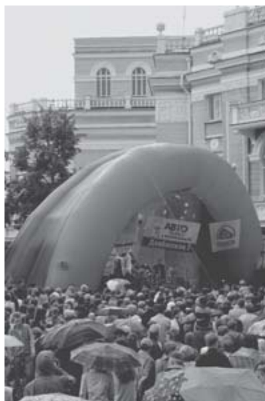
Несмотря на окончание летней жары, в Екатеринбургском Доме ученых праздновали День города. В фоторепортаже М. Макаровой (ИИиА УрО РАН) — концерт Игоря Бутмана на площади перед оперным театром.